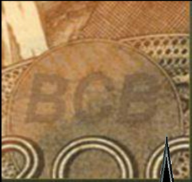
Imagen escondida con la sigla BCB